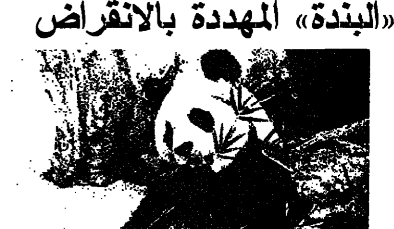
البنتدة الجامعة تنتظر المساعدة

ولكن تقابلات عمال صف الاحرف تعارض بشدة ما تعتبره في ذلك تجاوزاً على حقوق اعضائهم بدعوى انه اذا سمح بزاولة عمل الصف للمصاحبيين وغيرهم ممن لا يتقنون اي مهنة صف الاحرف فان ذلك سيضيع على اصحاب المهنة فرص العمل وبالتالي يمرض محرر رزقهم للخطر والانشغال بسبب التكنولوجيا الحديثة . وما تعنيه نقابة عمال صف الاحرف